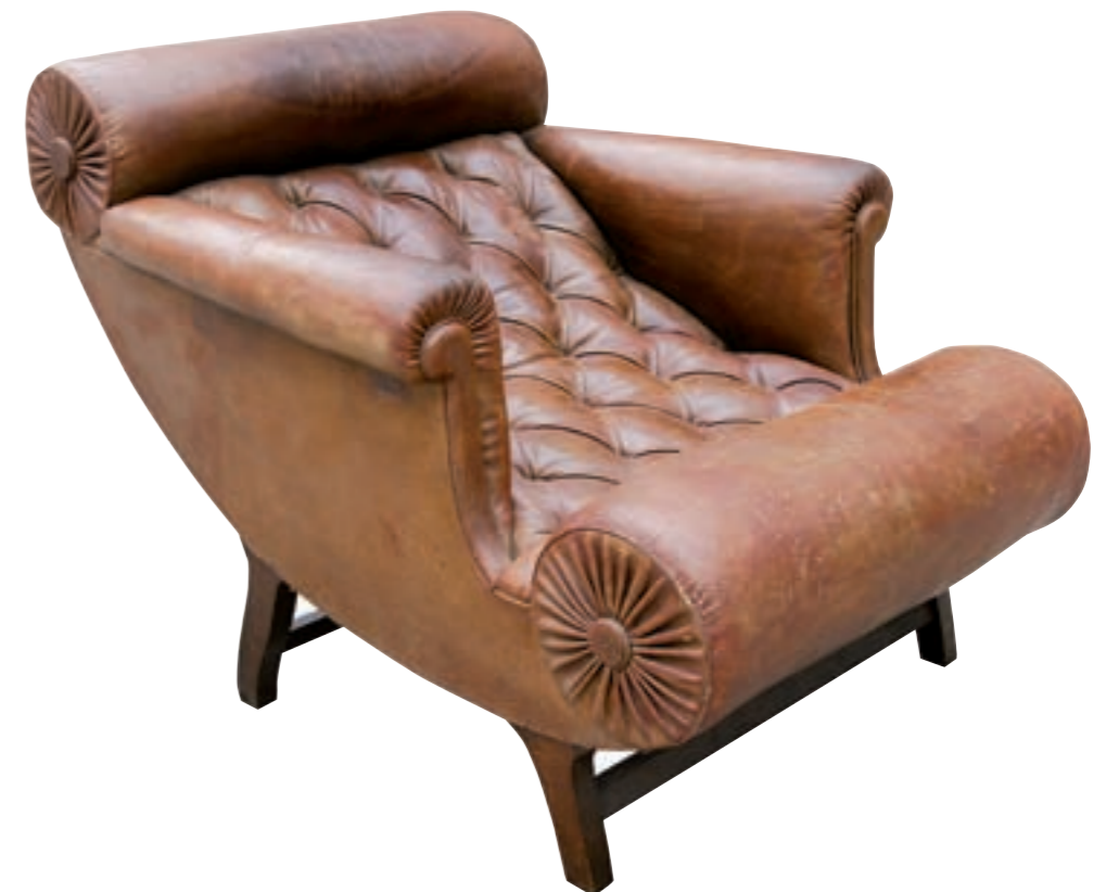
▶ ADOLF LOOS (1870-1933) „Knieschwimmer“ um 1910 orig. Lederbespannung

Wir danken für die positive Zusammenarbeit: COMMERZBANK (Schweiz) AG, LEXUS DIVISION und UNIQA Kunstversicherung