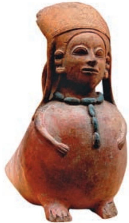
▲ Götteridol in Form eines Vogelmenschen, der Jama-Coaque-Chorrera-Kultur zugeordnet, 100-300 n. Chr., Jambeli, Ecuador gebrannter Ton, bemalt