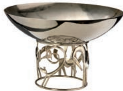
▲ Aufsatzschale mit Pferden Werkstätte Hagenauer Wien, nach 1960 Messing vernickelt, Maße: H: 16,4 cm