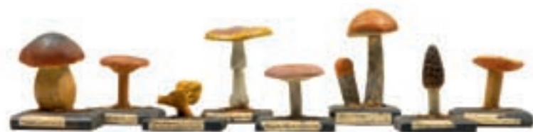
◀ Pilzmodelle Holz geschnitzt und farbig gefasst, alte Beschriftungsetiketten, 2. Hälfte 19. Jhdt. Max. H: 15 cm

40 JAHRE – UND GANZSCHÖN JUNG „Jung geblieben und dabei immer jünger geworden“ lautet das Motto der diesjährigen Kunst- und Antiquitätenmesse in der Wiener Hofburg. Hier mischen sich die Glanzstücke alter Kunst mit denen der Zeitgenossen und präsentieren eine 40-jährige Erfolgsstory. Seit 33 Jahren von MAC-Hoffmann betreut, entwickelte sich die 1968 vom Landesgremium des Kunst- und Antiquitätenhandels gegründete Institution von der rein österreichischen Messe ab 1995 auch zur Plattform für internationale Aussteller. Bis zu 50 Händler, die alle zur Elite ihrer Zunft gehören, sind zum Anziehungspunkt für ein internationales Publikum geworden, das höchste Qualität und Originalität schätzt. So gilt die Wiener Messe schon seit Jahren als Gradmesser der Kunst- und Antiquitätenszene, was das Angebot und die Präsentation betrifft.