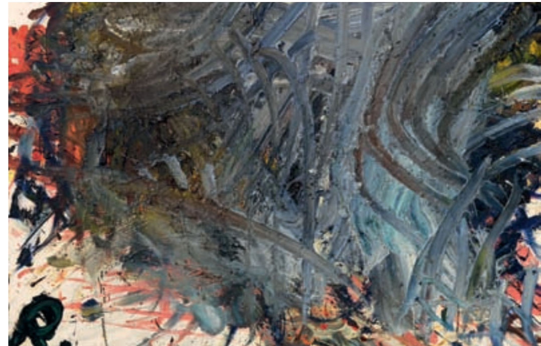
▲ ARNULF RAINER (*1929) „Fingermalerei“ Öl/Karton/Holz, 51x73cm, signiert, 1982/87