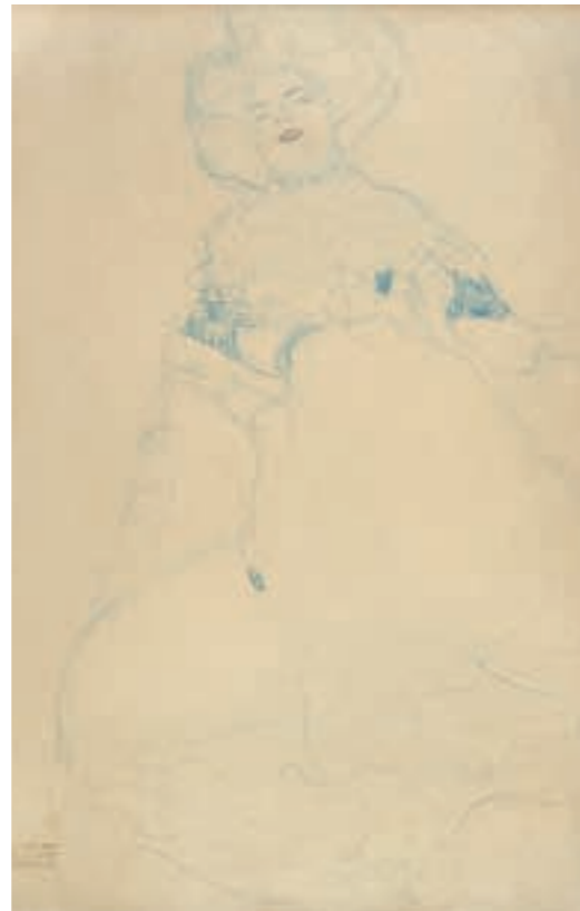
▼ GUSTAV KLIMT (1862-1918), Sitzende Dame mit Hut, um 1910 Bleistift und roter Farbstift auf chamoisfarbenem Simili-Japanpapier, 560x370 mm Nachlassstempel links unten