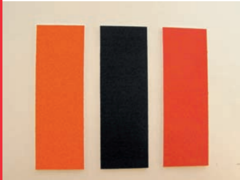
▼ BERNARD AUBERTIN (*1934) Trip tyque tricolore Acryl auf Leinwand 2007 Je 150x50 cm