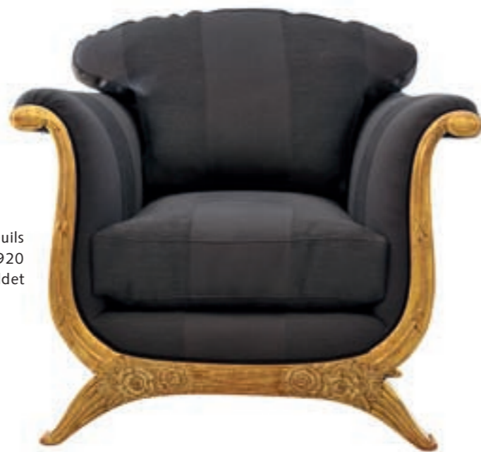
▶ Einer von zwei Fauteuils Frankreich um 1920 vergoldet