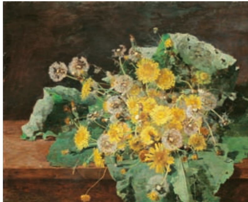
▲ TINA BLAU (1845-1916) „Blühender Löwenzahn“ Öl/Holz 49,2x63,3 cm Signiert links unten: T. Blau