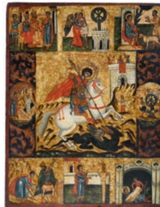
◀ "Heiliger Georg mit Vita-Szenen" Eitempera/Holz Makedonien (Griechenland), ca. 1700 62×49 cm