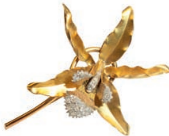
▲ Goldene Brosche, 18ct, mit Platinauflage, geziert mit Achkantdiamanten, Frankreich um 1950