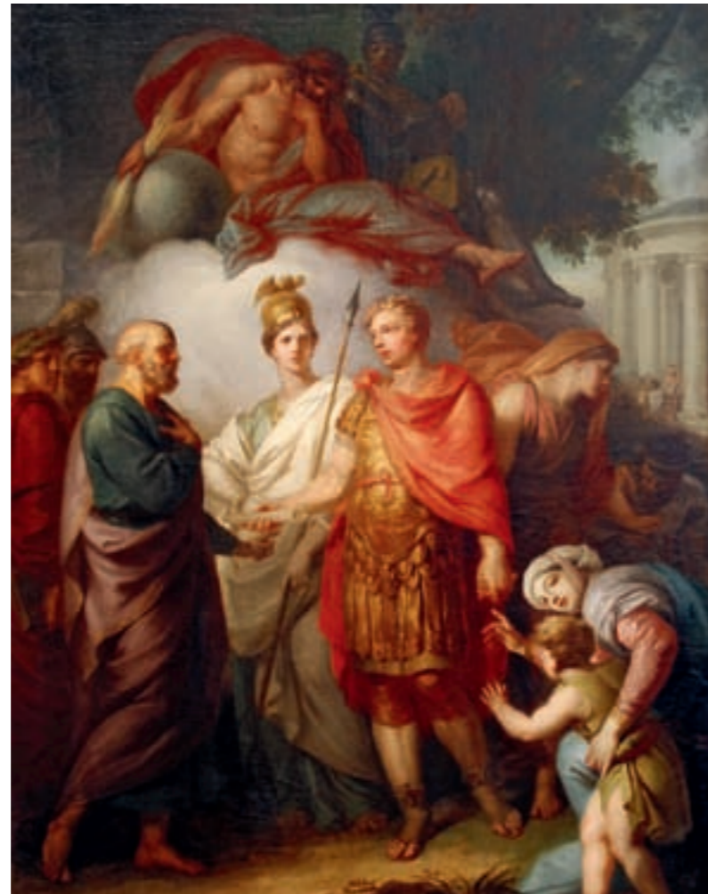
▲ HEINRICH FRIEDRICH FÜGER (1751-1818) Apotheose auf Kaiser Josef II Öl/Leinwand, 98x73 cm